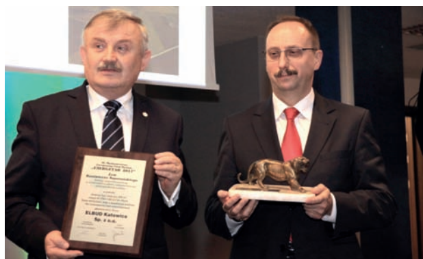
Wręczenie Statuetki „Złotego Lwa” Fundacji im. K. Szpotańskiego

Wiodącym tematem na stoisku TAURON Dystrybucji S.A. – Strategicznego Partnera targów – było w tym roku efektywne energetycznie oświetlenie, istotne zagadnienie nie tylko dla licznie odwiedzających targi samorządowców miast i gmin, zainteresowanych obniżeniem kosztów energii elektrycznej jak i eksploatacji oświetlenia ulicznego.