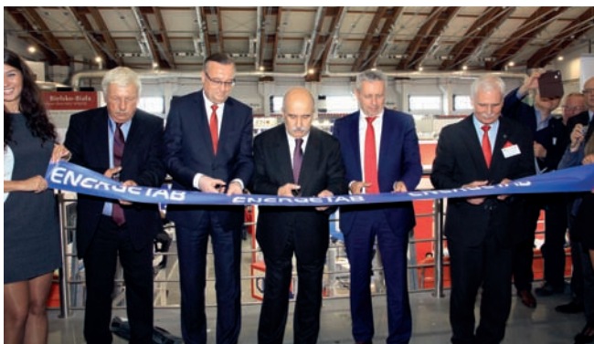
Otwarcie Targów ENERGETAB 2017

Podczas tegorocznych Międzynarodowych Targów Energetycznych ENERGETAB 2017 – które odbyły się w dniach 12-14 września 2017 r. na terenach ekspozycyjnych ZIAD Bielsko-Biała SA – swoje najnowsze produkty zaprezentowało 709 wystawców z 23 krajów Europy i Azji, a także Egiptu. Była to jubileuszowa, 30. edycja tych targów, które wśród europejskich targów branży energetyki i elektrotechniki zajmują bardzo ważną pozycję – nie tylko ze względu na wielkość targów, ale też i ze względu na wielkość polskiego rynku inwestycyjnego w tej branży. Temat perspektyw inwestycyjnych w polskiej infrastrukturze sieciowej był tematem wiodącej konferencji towarzyszącej targom, podczas której o potrzebach i kierunkach rozwoju, zarówno sieci przesyłowych jak i dystrybucyjnych, debatowali najważniejsi inwestorzy na tym rynku – przedstawiciele PSE SA oraz TAURON Dystrybucji SA .