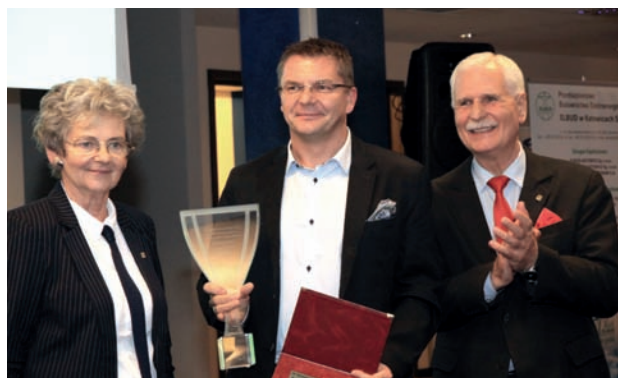
Wręczenie Pucharu Redakcji Energetyki

Sporym zainteresowaniem cieszył się konkurs multimedialny – zorganizowany po raz drugi na targach. Kilkudziesięciu ze zwiedzających, którzy wykazali się dużą wiedzą o niektórych produktach i Wystawcach, wyjechało z targów z cennymi nagrodami.