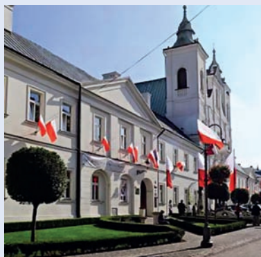
Widok dzisiejszy na budynek I LO