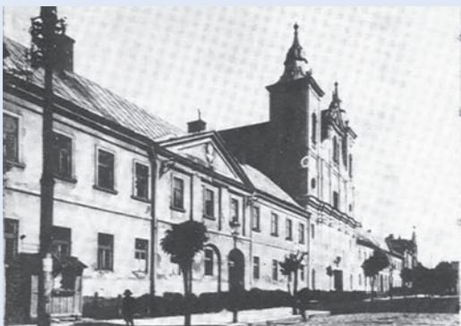
Kolegium Pijarskie w Rzeszowie (obecnie I Liceum Ogólnokształcące im. ks. Stanisława Konarskiego)