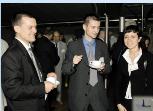
Młodzież coraz liczniej zasila szeregi SEP, zwłaszcza w Oddziale Szczecińskim